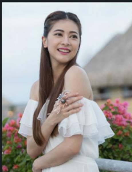
冠軍 公開組 I