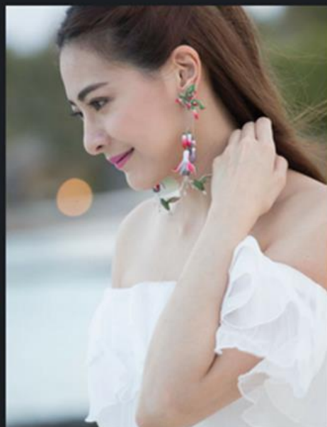
冠軍 及 我最喜愛珠寶設計大獎 公開組 II