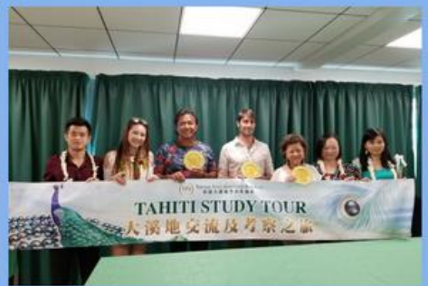
與當地官員及地方代表會面